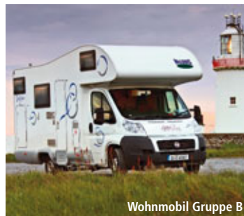
Wohnmobil Gruppe B