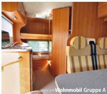
Wohnmobil Gruppe A