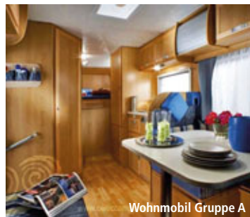
Wohnmobil Gruppe A