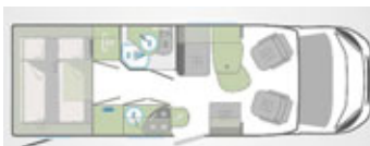
Ansicht Tag + Nacht