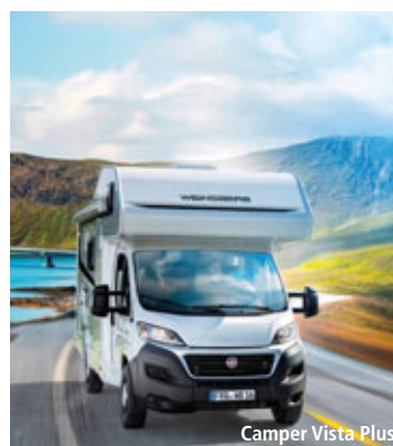
Camper Vista Plus